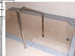
↑ 浴室 ↓