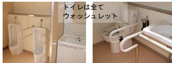
トイレは全てウォッシュレット